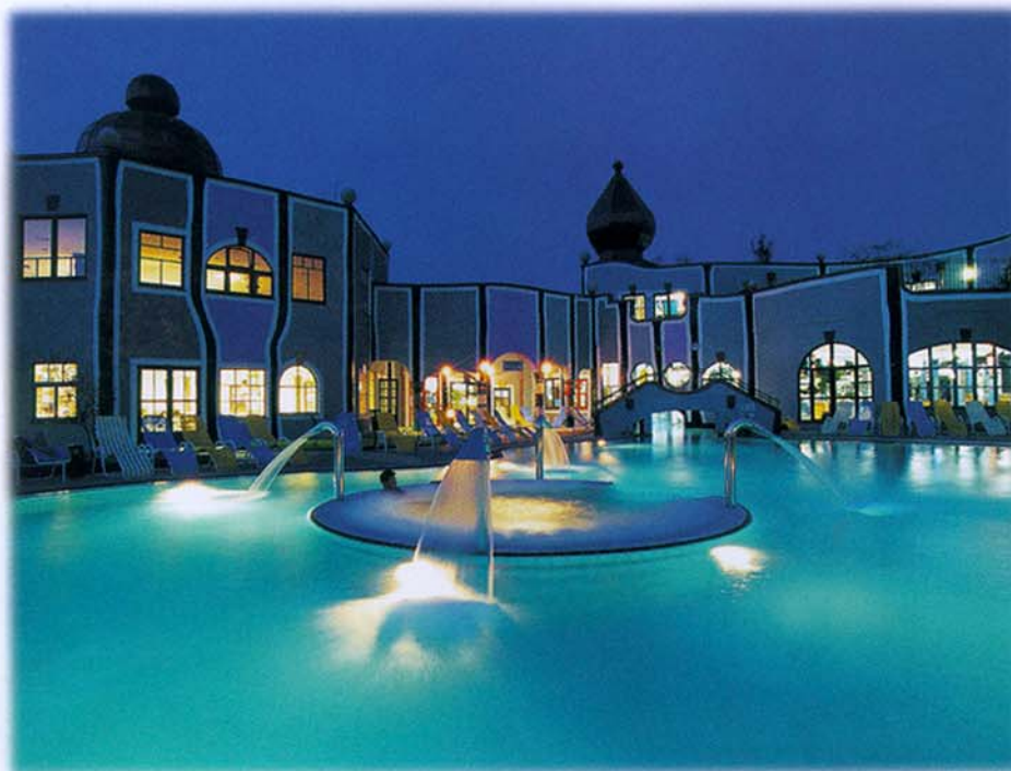
Die fantastische Wasserlandschaft am Abend.